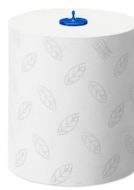
Tork Adv. Rollenhandt. Weich 2lg150m 290067