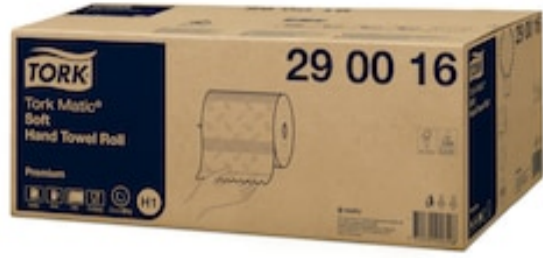
Tork Matic weiches Rollenhandtuch PremH1 290016