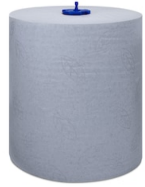
Tork Matic blaues Rollenhandtuch Adv H1 290068