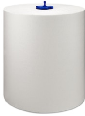
Tork Matic langes Rollenhandtuch Uni H1 290059